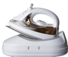
コードレススチームアイロン