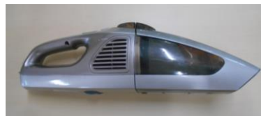
コードレス掃除機