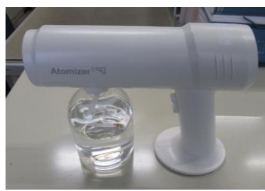
コードレス噴射機