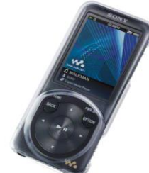
ポータブルオーディオプレーヤー