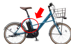
電動アシスト付き自転車のバッテリー