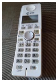
コードレス電話機