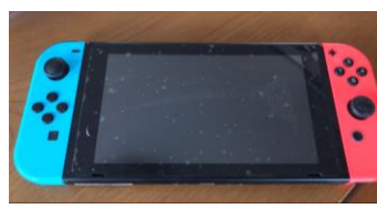
ポータブルゲーム機