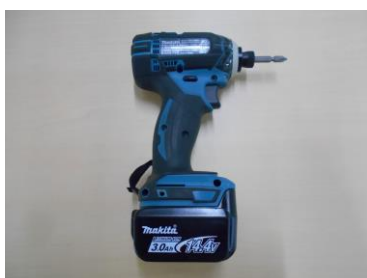
電動式ドライバー