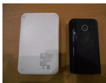
モバイルバッテリー