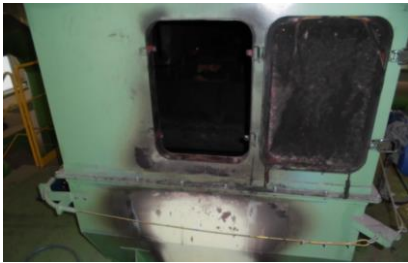
ベルトコンベア上部

令和5年7月7日、大崎広域リサイクルセンターでベルトコンベアの一部が焼損する火災が発生いたしました。発火原因はリチウムイオン電池によるものと判定されております。