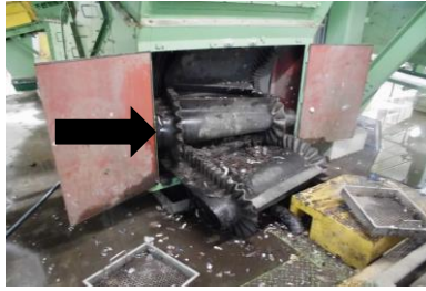
焼損・脱落したベルト

リチウムイオン電池は、充電して何度も使用できる製品やコンセントから抜いても使える製品に多くに使われており、強い衝撃や圧力が加わることで発火し 大変危険 です。