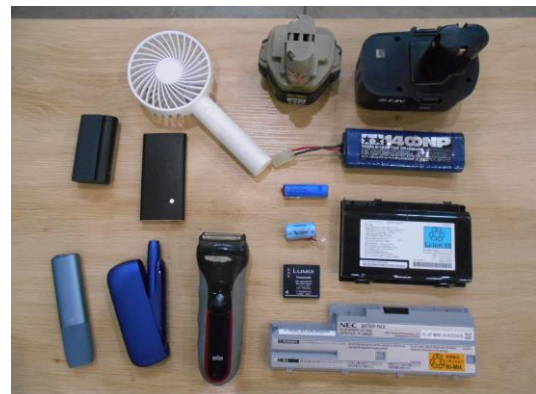
リチウムイオン電池使用例

○リチウムイオン電池は オレンジ色の「小型家電・乾電池」 のボックスに入れてください。