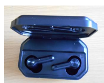
ワイヤレスイヤホン