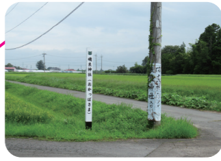
★磯良神社への看板