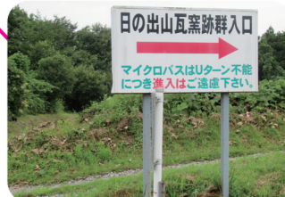
★日の出山瓦窯跡への看板