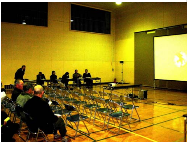
推進室からの説明のようす(コミュニティーセンター)

これは、小中一貫教育実現に向けた取組について、当初の計画とどのように変わり、どの程度進んでいるのか、今後の見通しはどのようになっているのかなどについてお話しし、ご意見・ご要望等があればお聞きしようという考えのもとに実施したわけです。実施にあたっては、できるだけ多くの方々に参加していただきたい