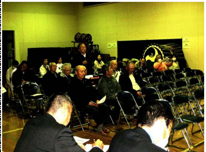
質疑・応答のようす(コミュニティーセンター)

校舎等施設についても、今年中にいくつかの素案が上がってきます。来月の第4回推進委員会では、今回の住民懇談会でいただいたご意見等をもとに更に検討し、方向性を明確にしていきたいと考えております。